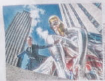
Koons neben seinem Kunstwerk

...innerhalb von zwei Stunden sogar 30 Liter Regen pro Quadratmeter herunter. Am Sonntag besteht vor allem im Südosten des Landes Gewitterrisiko.